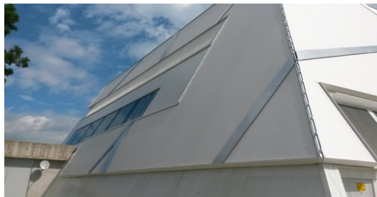
SCA Shopping Center West, Salzburg, AT – 1.300 m 2 PTFE/Glas Fassade/facade

Here is a selection of further projects we've realized this year: