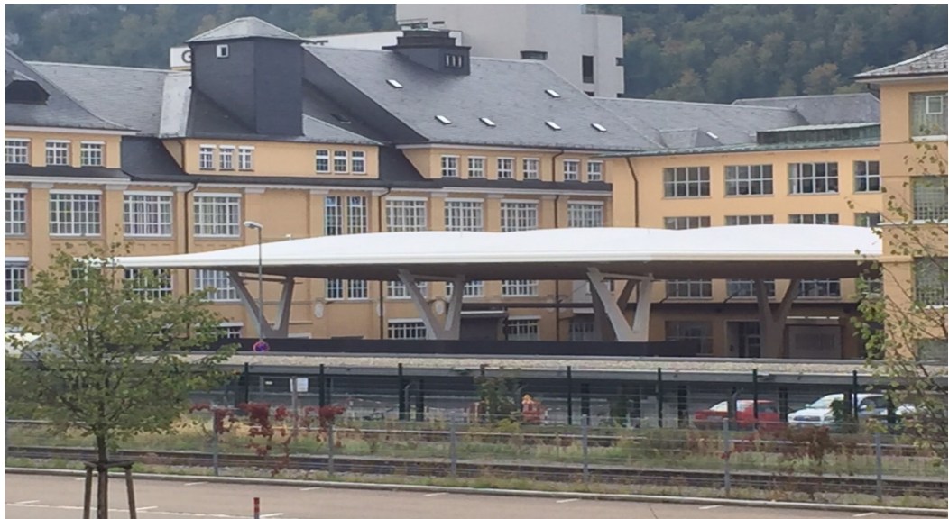
Logistikhof Fa. Groz-Beckert, Albstadt, DE