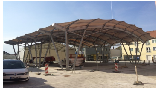
Bühnendach, Plattling, DE – 790 m 2 PTFE/Glas Dach/roof