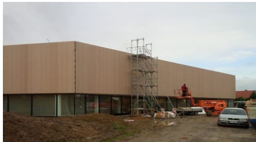
Golf House Bielefeld, DE - 1.050 m 2 PTFE/Glas Mesh Fassade/Façade

Über diese Projekte werden wir noch ausführlich berichten.